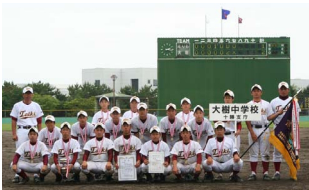
平成 19 年度 第 58 回大会優勝 大樹町立大樹中学校